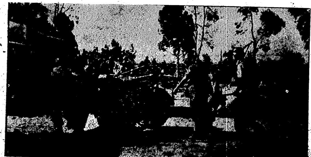
La enorme movilidad del frente del Este obliga a continuos desplazamientos de las armas. Estos soldados alemanes trasladan su botería al nuevo lugar elegido por el mando.