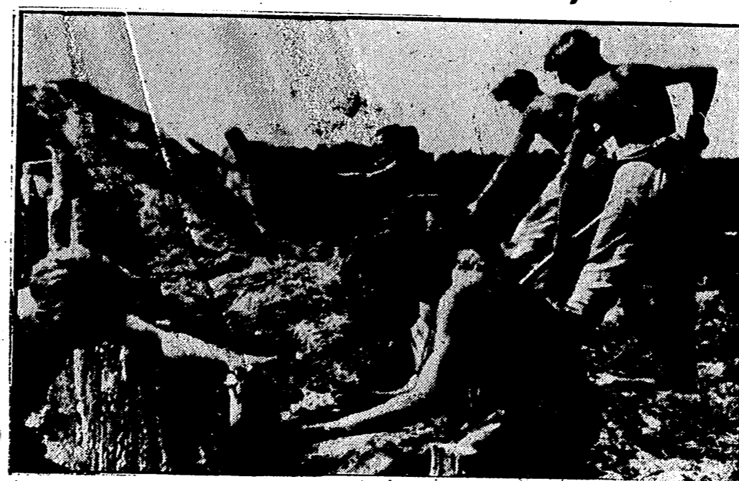
Constantemente Alemania refuerza las fortificaciones de Europa, y por medio de su Servicio de Trabajo, al que pertenecen estos jóvenes, prepara una sólida barrera que dificulte la invasión del Continente.