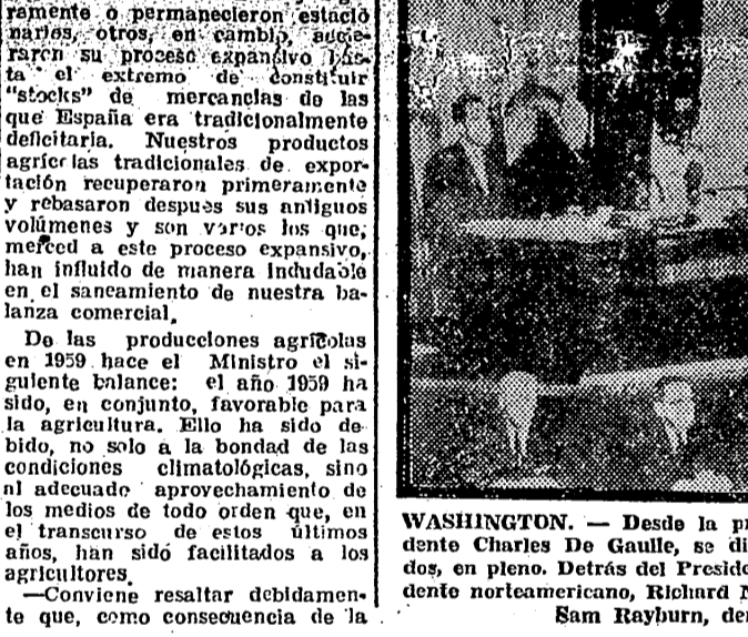
WASHINGTON. — Desde la presidencia de la Cámara, el Presidente Charles De Gaulle, se dirige al Congreso de los Estados Unidos...