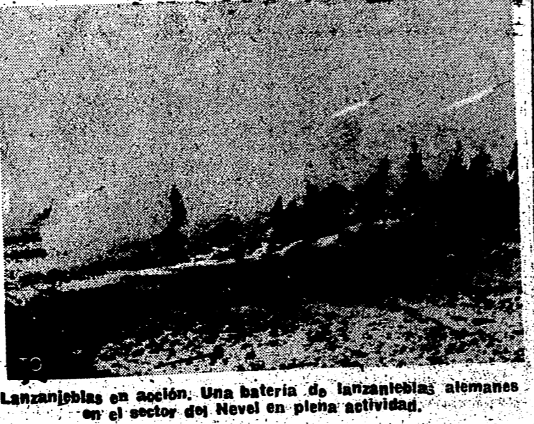
Lanzanieblas en acción. Una batería de lanzanieblas alemanas en el sector del Nevel en plena actividad.

del onés día motivo clausura mesa el Tojo ha dos Cá. sado su rápida u pro- mamen japonés potencial día. La mismo su resuelta ar todos os para asta un Efe. vito o.. primera.) on nuevos Se pnce dos medios ecimientos do primer Kaiuy, y se llevaron ción de su GOBIERNO HUNGARO la noche del Consejo de ara discutir er urgente, o Budapest. Efe. EL ESTADO MANO HA MOVILIZACION Una no- io Bucares Mayor rta moviliz- vences suje- pre-militar, ructores. an que pre- el fin de suma ur- rrios de no ularse cinco rde mientos ncia ver cuanto ha o podemos ia como a emania. No ue toda sit emocracia y cesar de puede hacer ar al ejército. ece que por estros bur- rar que Fir- a situación. e trata sde á una pro- e la cola. Estas ideas s recientes. Hull. Nues- a obligación porvenir lo el presente sde lejos, n- rmanente e no sean e- como el p- pendencia. el pueblo puede acer lleve con- de la n si la