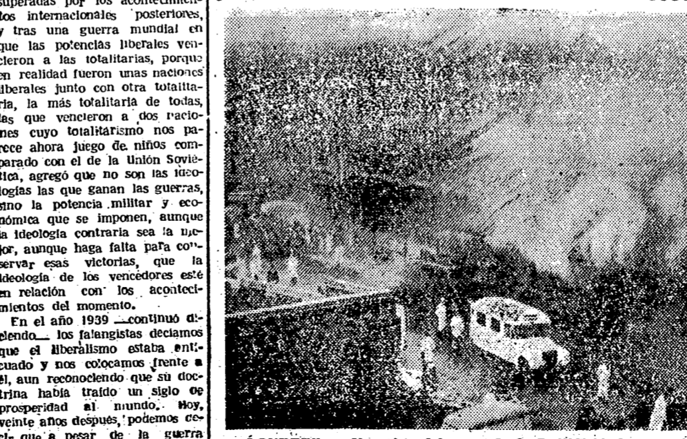
LONDRES. — Una vista del mercado de Smithfield, de la capital inglesa, durante el gigantesco incendio que ha costado la vida a dos hombres y por el que se estima que el valor de los daños por valor de unos 250 millones de pesetas.