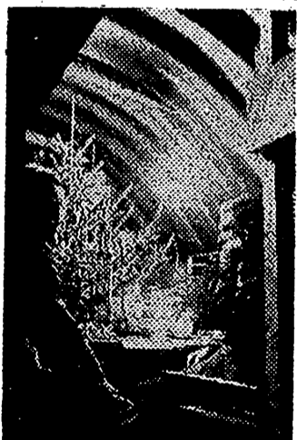
En todos los frentes los soldados alemanes celebraron las fiestas de Navidad. Escenó en la posición fortificada del Atlántico

des, Jerarquías y representaciones de Entidades económicas provinciales y locales, para dar cuenta del resultado de sus gestiones en Madrid, con vistas al remedio de los daños ocasionados por los pasados temporales.