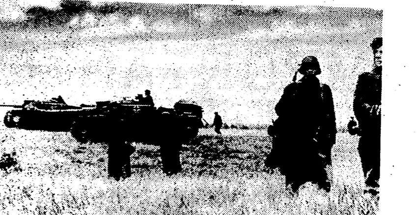
El Mando alemán dispone en Rusia de importantes reservas, como ha demostrado su activa reacción en el sector de Kiev. Cuando la penetración rusa hizo peligrar el dispositivo alemán en esta región, importantes masas de tanques e infantería han entrado en acción y obligado al enemigo a ceder importante terreno y gran número de poblaciones.