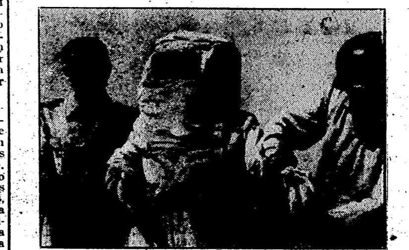
En el frente hacen falta prevenir muchos peligros entre ellos este de los incendios causados por explosiones que pueden provocar grandes calamidades. Para luchar contra el fuego los destacamentos alemanes disponen de algunos trajes de estos que muestra la foto y que son como escarfantras de huzo pero insensibles al fuego.