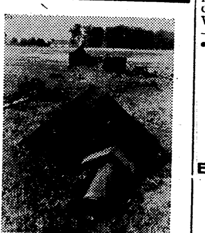
Los carros gigantes de los rojos con los cuales habian de someter a Europa, yacen así en tierras soviéticas, desventrados y rotos en pedruzcos por la acción de la artillería y aviación germanas.

Entre dichos barcos se encuentra el "Tatuta-Maru".