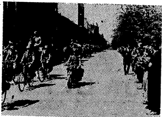
En su avance inicial por las tierras soviéticas, esta vanguardia de las fuerzas alemanas penetran en Kovno, capital de Lituania, liberada ya del yugo bolchevique.

Madrid, 26. — El Sindicato Nacional de Industrias Químicas, Sección papel, ha publicado una nota por la que pone en conocimiento de las Universidades, Escuelas Especiales, Centros de Investigación y particulares, que por medio de esta Sección se han puesto a disposición de los librereros importadores, divisas extranjeras de todas clases, en cantidad suficiente, para que puedan aceptar cuantos pedidos se les encomienden de libros y revistas científicas del extranjero. — Cifra.