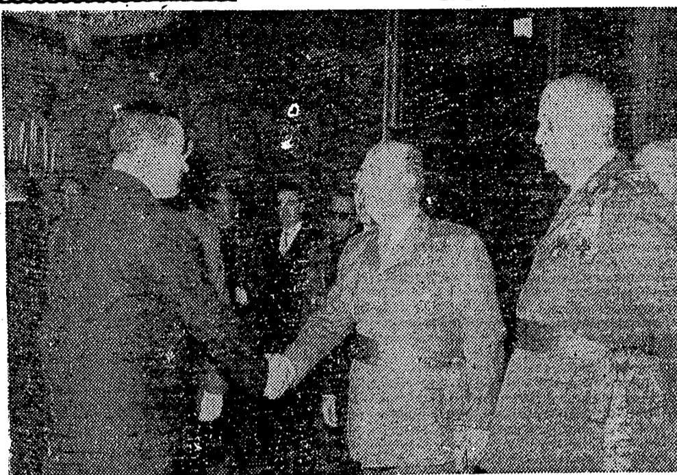
MADRID. — S. E. el Jefe del Estado, durante la audiencia concedida a la Comisión de la Hermandad Nacional de Alferoces Provisionales, presidida por el Ministro del Ejército.