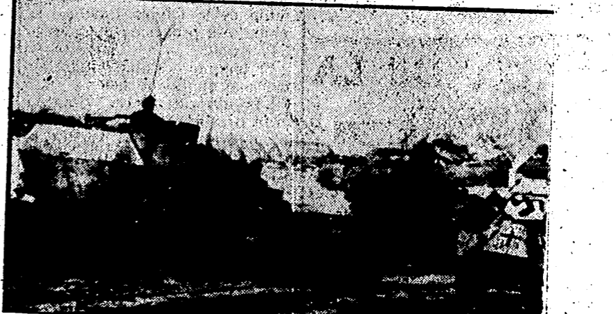
Alemania manda al frente Oriental los primeros refuerzos y entre ellos importantes contingentes de tropas acorazadas que han de enfrentarse a los soviets en las próximas batallas.