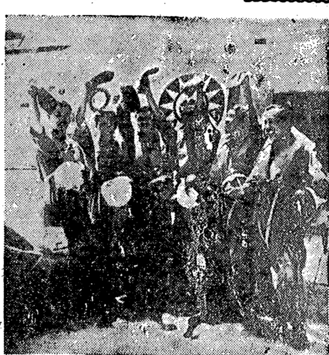
TAIPEI. — Estos seis pilotos nacionalistas chinos aparecen fotografiados de regreso a su base, tras haber derribado cinco «Mig» comunistas, en una batalla aérea cerca de las islas Quemoy. Los pilotos nacionalistas forman una escuadrilla de «F-85 Sabrejets».