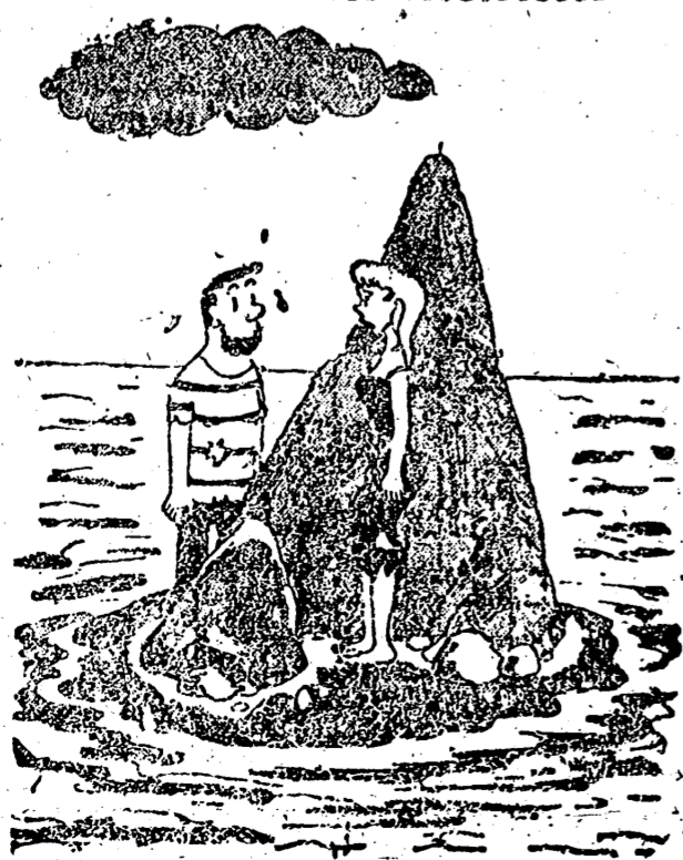
—Usted otra vez

Muchas acciones concretas demuestran que Stalin intentaba hacerse con Manchuria independientemente del desarrollo de los demás acontecimientos en China. A la población de la China del Norte ocupada por las tropas soviéticas se la dio a entender desde el primer momento que el Kuomintang no volvería a esta parte de China. Las innumerables banderas del Kuomintang que habían colgado los habitantes de las ventanas al capitular el Japon fueron hechas desaparecer y sustituidas por banderas comunistas a los dos o tres días de ser colgadas y el armamento cedido a los japoneses fué entregado a los ejércitos comunistas. Pero las relaciones con el gobierno del Kuomintang no se rompieron. La Manchuria y la China del Norte ocupadas por los comunistas, debían de quedarse en poder de éstos. Pero la China restante, Stalin estaba preparándose para entregársela al Kuomintang. El completo dominio de la China no entraba en sus planes y sólo intentaba consolidar y retener el poder en los distritos conquistados, y además a la cabeza de estos territorios no pensaba colocar a Mao Tse Tung.