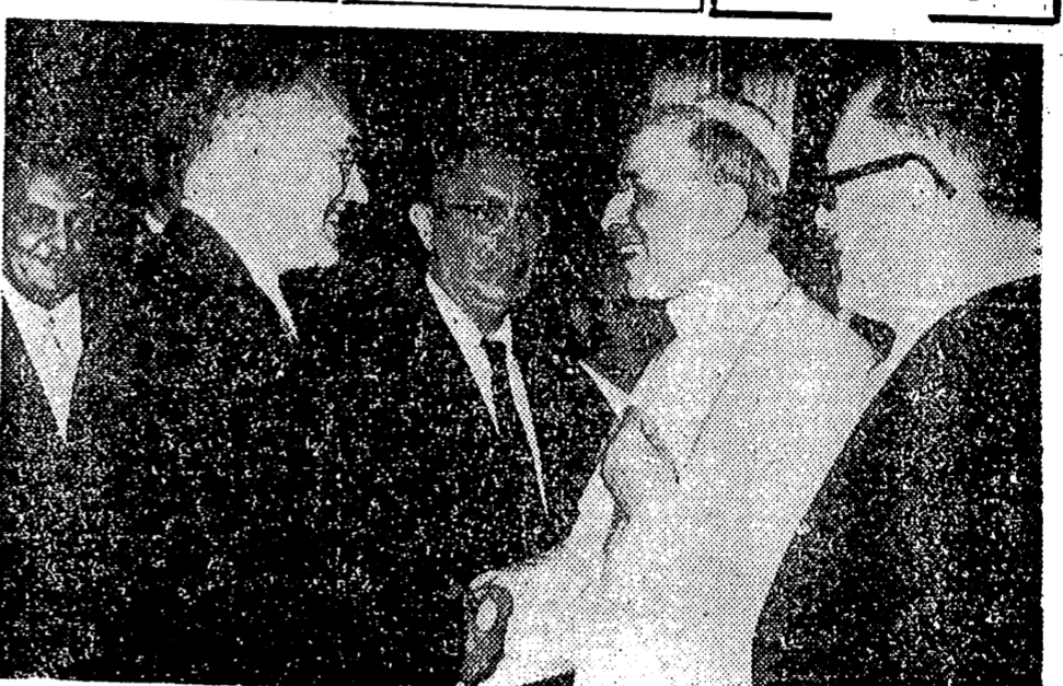
CASTELGANDOLFO. — Su Santidad el Papa recibió en audiencia a los miembros de la Unión Internacional contra el Cáncer. En la foto aparece Pío XII conversando con el profesor Dorn, de América.

HUELGA ANULADA CASABLANCA, 25. — Ha sido anulada la proyectada huelga de panaderos en todo el territorio marroquí. Las gestiones llevadas a cabo por las autoridades marroquíes han conseguido que los panaderos