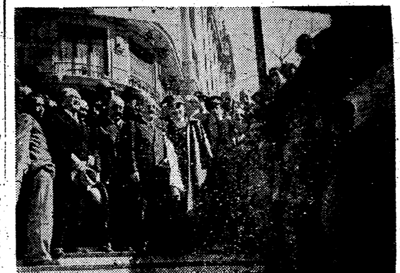
Recientemente ha sido inaugurada una nueva línea del Metro de Madrid. En la foto aparecen el Ministro de Obras Públicas y otras Autoridades en el acto inaugural en la estación de Argüelles.