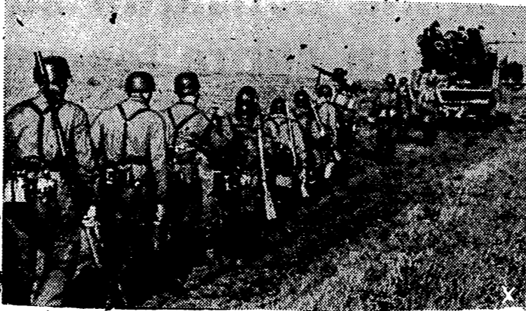
Ultimamente las fuerzas alemanas que se defienden tan eficazmente en Cassino han sido reforzadas por grupos de paracaidistas, uno de cuyos grupos presenta la foto en marcha hacia dicha ciudad.