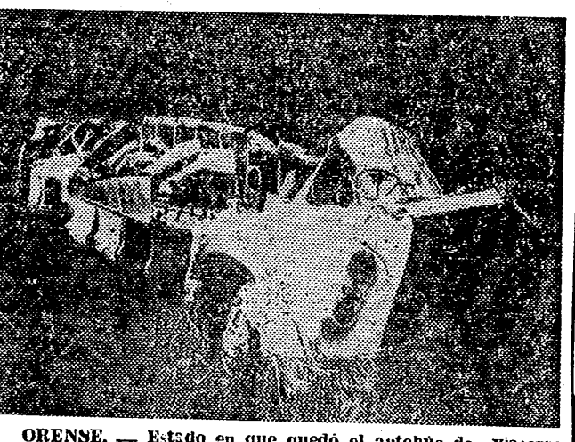
ORENSE. — Estado en que quedó el autobús de viajeros en la línea Orense - Puente Barjas, después de despeñarse por un precipicio de 200 metros...