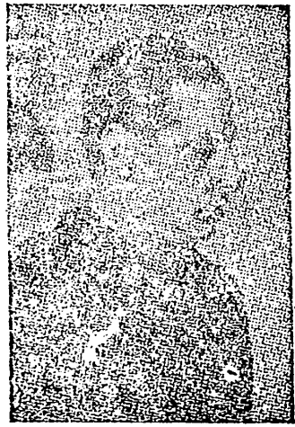
La labor de proselitismo que nos hemos impuesto.

Yo he de tratar, en esta charla íntima y solemne, de haceros comprender de vosotros la apremiada necesidad de establecer un más completo enlace, de aunar estrechamente nuestros servicios, ensamblando con justicia para ir hacia el más apartado rincón de España, en donde es tan precisa nuestra presencia, a ejercer nuestra misión de apostolado y