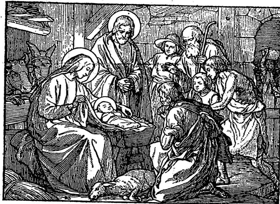
En Belen, como habian anunciado los profetas del antiguo Testamento, vino Jesucristo al mundo. En plena paz augusta y durante el apogeo del Imperio Romano. El eligió, para nacer, la ciudad humilde de Judea y el lecho de paja de un establo abierto a la intemperie

Nosotros quisiéramos que estas Navidades fuesen las últimas de esa absurda, e inhumana, distanciamiento entre hermanos que deben vivir unidos en Cristo; nosotros quisiéramos que el espíritu cristiano de Hermandad — que es también el espíritu de Hermandad de la Falange — calara tan hondo en las almas de todos los españoles que, para las fiestas navideñas del próximo año fuera ya una realidad viva y operante la participación suprema de nuestro Caudillo y la exigencia imperativa del Movimiento: la unidad, íntima, inquebrantable, de los hombres y de las clases de España.