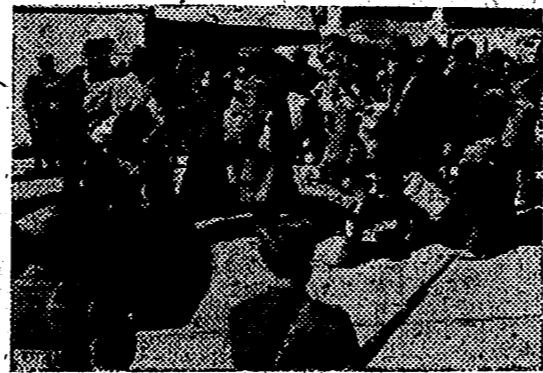
Prisioneros británicos capturados en las últimas operaciones en Africa septentrional son embarcados para ser trasladados a Italia a los campos de concentración de la península.

En el frente central se acusan progresos alemanes en el ala sur hacia Maloyaroslavet, que sin embargo no constituirá una amenaza grave para Moscú si simultáneamente no es seguido de progresos semejantes por el ala norte o izquierda hacia Dimitrovska y Sereychevskij.