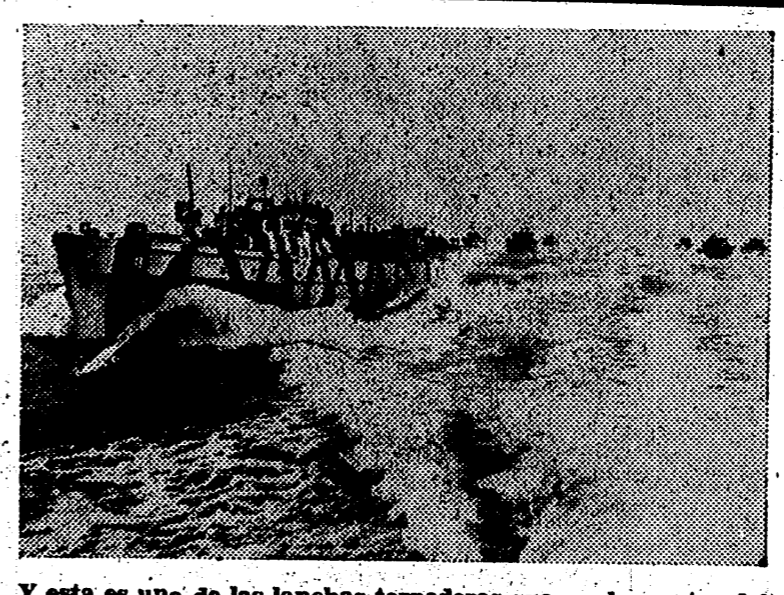
Y esta es una de las lanchas torpederas que, en las costas del Canal, tienen a diario una intervención eficaz contra la navegación enemiga.

na del III. Reich prueba a los comandantes de sus barcos submarinos.