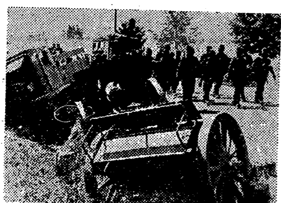
Mientras las tropas alemanas avanzan victoriosas sobre tierra rusa para aniquilar todo rastro soviético, quedan a retaguardia cantidades enormes de material que los rojos abandonaron, unas veces destruido por la artillería germana, y otras en disposición de ser utilizado en el acto por los vencedores.

Madrid, 24. — La Legación de Bolivia en Madrid ha hecho saber al Gobierno español que el día 19 de julio fueron descubiertas y comprobadas las actividades para provocar en Bolivia un movimiento totalitario con la colaboración del Ministro de Alemania en La Paz. Como consecuencia de ello, el «Gobierno boliviano» declaró el estado de sitio en toda la República y declaró que el Ministro de Alemania había dejado de ser persona grata en Bolivia. — Cifra.