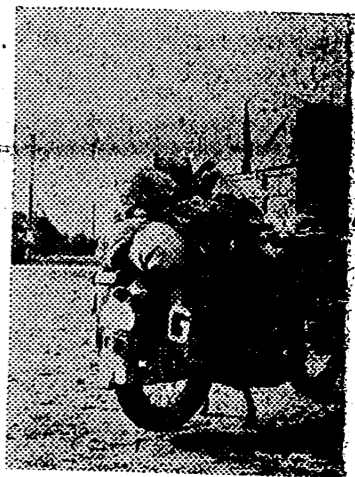
Días y días de un combatir sin tregua, hace que los soldados alemanos aprovechen la más leve parada para descansar sobre el armamento, como hace este en la misma máquina que le lleva y le trae hace ya un mes, por las vanguardias alemanas en las tierras soviéticas.

Madrid, 24. — Hoy por la mañana han llegado procedentes de Italia, una veintena de chicos y chicas españolas, invitadas por el Sr. Ministro de Asuntos Exteriores y Presidente de la Junta Política, para pasar unas semanas en los campamentos de verano del Frente de Juventudes. A su llegada a la frontera, el Jefe de la expedición puso el siguiente telegrama al Delegado Nacional del Servicio Exterior de Falange Española Tradicionalista y de las J. O. N-S: «Al pisar tierra en nuestra querida España, los muchachos del Frente de Juventudes en Italia, entusiasmados, agradecen la iniciativa del Ministro de Asuntos Exteriores, camarada Serrano Suñer, que les ha proporcionado ocasión de conocer la Patria de sus mayores. ¡Saludo a Franco! ¡Arriba España!» Los expedicionarios descansarán en Madrid y efectuarán diversas visitas en la Capital de España, acompañados de los camaradas del Frente de Juventudes, que han venido con ellos desde Barcelona y los camaradas de Madrid. Los muchachos han marchado al Escorial y las muchachas al campamento de La Peña, en Cercedilla. En días inmediatos llegarán a España hasta otros doscientos chicos de la Falange Española de Alemania, Francia, Portugal y Marruecos, invitados, igualmente, por el Ministro-Presidente de la Junta Política. — Cifra.