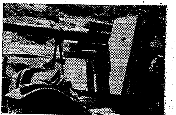
Esta modernísima pieza de artillería móvil, fué algo de lo que los soldados de Wavel dejaron en poder de las fuerzas del Eje, después de aquella batalla de tres días en las tierras calientes de Solhum, organizada por el mando inglés con el sólo objeto de conocer la capacidad de resistencia de los soldados italo-alemanes.

Sevilla, 24. — El Ministro de Agricultura recorrió por la mañana las zonas cultivadas del valle inferior del Guadalquivir acompañado de Jerarquías del Movimiento y de elementos técnicos en materia agrícola. Por la tarde visitó las marismas a fin de apreciar las plantaciones de arroz y de algodón, y otros cultivos que se ensayan con éxito en dichos terrenos. — Cifra.