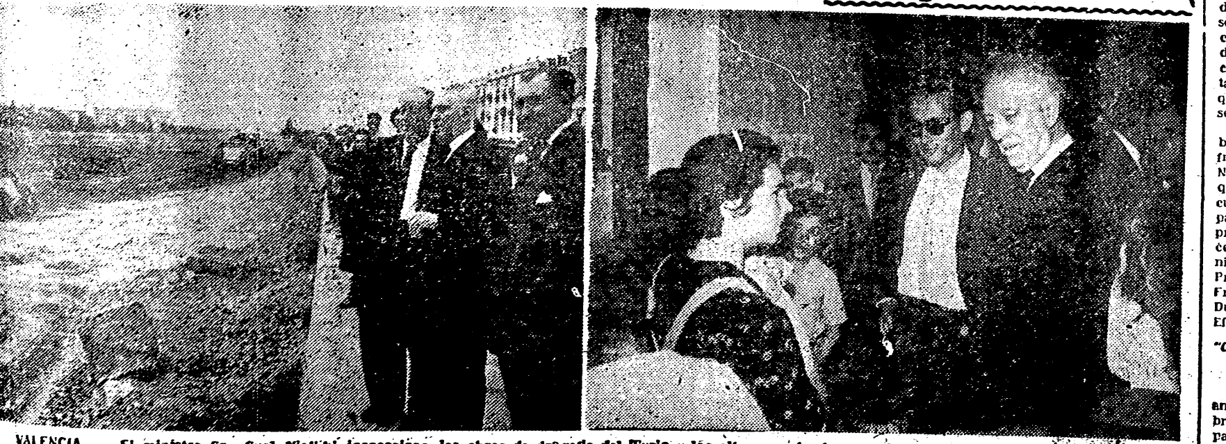
VALENCIA. — El ministro Sr. Gual Villalbí inspecciona las obras de dragado del Turia y los albergues donde se cobijan los damnificados por las inundaciones del pasado mes de octubre.