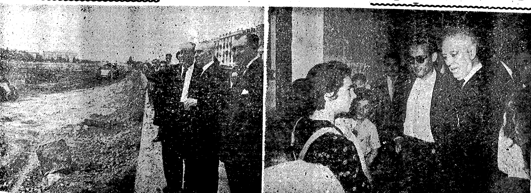
VALENCIA. — El ministro Sr. Gual Villalbí inspecciona las obras de dragado del Turia y los alberques donde se cobijan los damnificados por las inundaciones del pasado mes de octubre.