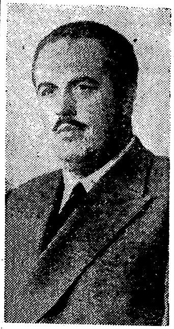
MADRID, 24. — En la clausura de la IV Asamblea Nacional de graduados sociales se ha leído el siguiente mensaje enviado por el Ministro de Trabajo, Sr. Girón:

"Comaradas: Acabáis de celebrar vuestra cuarta Asamblea Nacional, con lo que la Asociación Nacional de graduados sociales avanza un paso más hacia la madurez de una clase que constituye el principio de un futuro progreso español para un futuro próximo." El signo que de nuestro tiempo está marcado por decisión irrevocable de la historia, es el signo de la justicia. Piensan en quimeras y sueñan con fantasmas quienes piensan que el mundo puede seguir en el camino que por una sola clase y para una sola clase, o quienes sueñan con el retorno de antiguos privilegios que se han retirado por el foro de la Historia como últimos restos del feudalismo para ser reaparecidos jamás. La fuerza social que emerge del fondo de la naturaleza misma de nuestro tiempo ha invadido todos los sistemas políticos del universo. Solamente seres ajenos a los sentimientos, viejas estructuras erráticas en torno a los alcázares vacíos de los viejos sistemas, pueden imaginarse que el mundo puede dar marcha atrás y que pueden volver a organizarse los cortes de la Justicia disfrazada con los ridículos harapos de un mundo en decadencia. La Revolución Nacional que acudilla Franco, alza cada día con más firmeza, con más orgullo, con más irrevocable decisión de ser obedecida, su tema de justicia social.