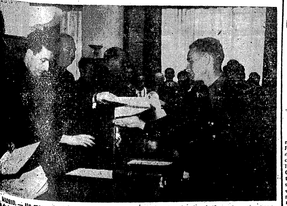
MADRID, 24. — Un momento del acto de clausura de curso y en entrega de títulos a los componentes de la XVII promoción de oficiales instructores, celebrado en la Escuela Nacional de Mandos, bajo la presidencia del vicesecretario general del Movimiento, Sr. Salas Fombó, y otras autoridades.

GUY BUENO Londres adopte medidas... de los Estados Unidos... programas de ayuda... se cree que harán... reduzcan sus... seguirán estando... protección así que... de Washington... del desafío soviético... industrial, político, cultural... Sin embargo, el... aplicarse esta medida... como fomento.