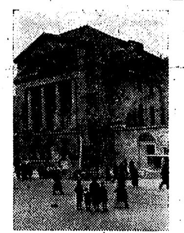
El Teatro de la Comedia en Potsdam, ligeramente tocado por una bomba enemiga caída en sus cercanías

Madrid, 24. — Su Excelencia el Jefe del Estado y sus Ministros han contribuido con carácter personal a la suscripción nacional pro-damnificados de Santander, con 25.000 pesetas.—Cifra.