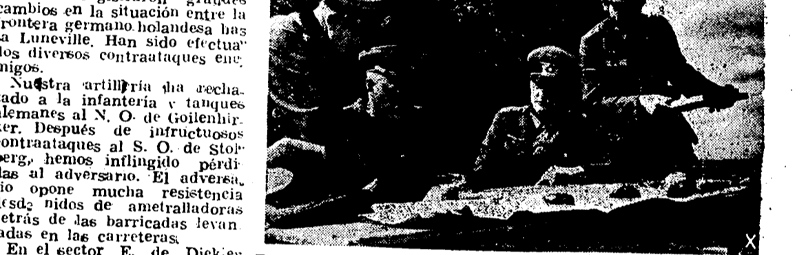
En la foto aparece el mariscal alemán Model, que se dice se ha hecho cargo del mando de las fuerzas alemanas en el frente del Oeste. El mariscal examina un gráfico con la situación del frente.