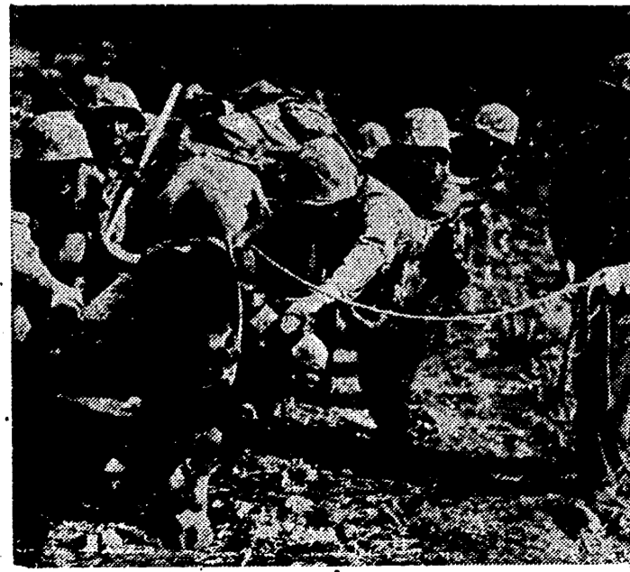
Las fuerzas norteamericanas se aproximan, tras saltos de isla a isla, a las Filipinas y al propio archipiélago nipón. Aquí aparecen las fuerzas norteamericanas desembarcando material bélico en una de las islas recientemente ocupadas.