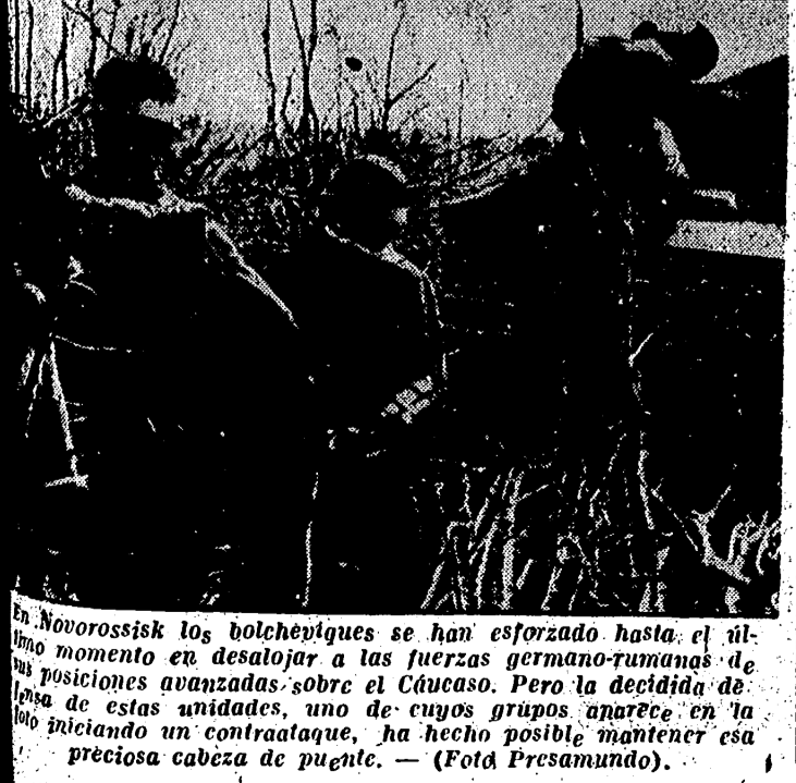
En Novorossisk los bolcheviques se han esforzado hasta el último momento en desatjar a las fuerzas germano-rumanas de sus posiciones avanzadas sobre el Cáucaso. Pero la decidida ofensiva de estas unidades, uno de cuyos grupos aparece en la foto iniciando un contraataque, ha hecho posible mantener esta preciosa cabeza de puente.