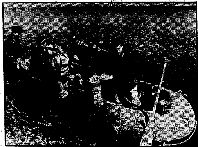
Por medio de estos pequeños botes neumáticos, las fuerzas alemanas realizan en Rusia, a través de los ríos, importantes servicios de abastecimiento a las unidades avanzadas.

París. — Las organizaciones especiales dan de comer a 400.000 parisinos diariamente. Corren a cargo de los alemanes 125.000 comidas y lo demás lo suministran los franceses. — Efe.