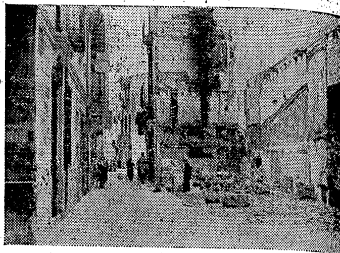
Pasada esa fecha trascendental del 14 de junio de 1938, Castellón progresa y ha entrado de lleno en una nueva etapa de su vida.