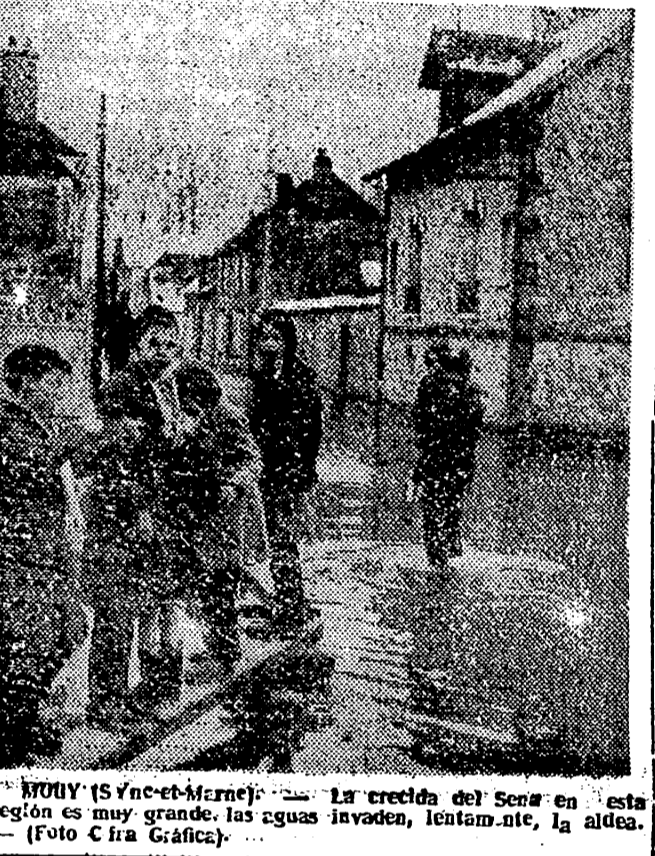
MOUY (Yve-et-Marne): La crecida del Sena en esta región es muy grande. Las aguas invaden, lentamente, la aldea.