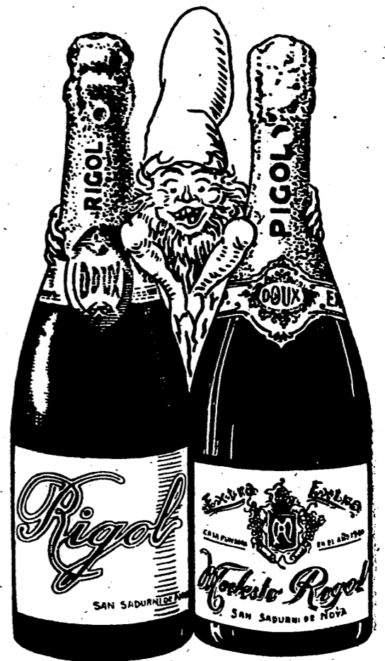
PEDID SIEMPRE EL CHAMPAGNE RIGOL

CALZADOS EL DOBLO, zapallitas, alpargatas y juguetes para Reyes, precios de fábrica. San Antonio, 27. — Almazora.