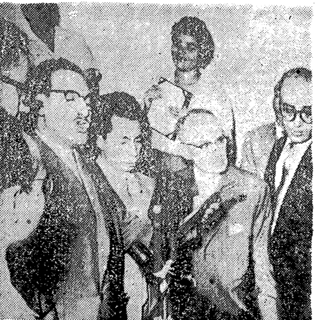
El CAIRO. — Rodeado por otros dirigentes del Frente de Liberación Nacional argelino y varios periodistas, Ferhat Abbas, anuncia la formación del "Gobierno provisional republicano de Argelia"...