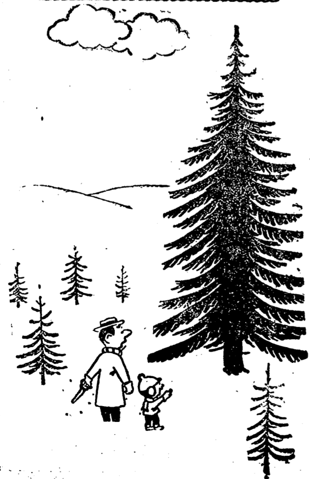
—Este me gusta, p.p.p.