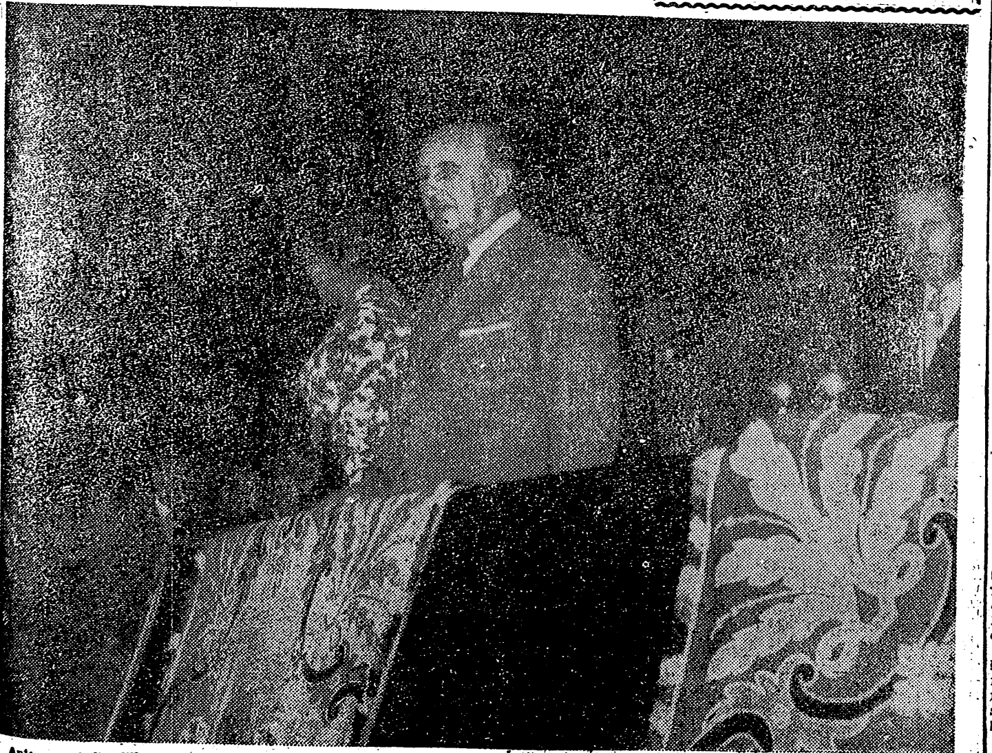
Antes de la final, acompañado de su esposa, asistió en Chamartín a la final de Copa, recibiendo constantes y fervorosas aclamaciones del gentío que se hallaba en el Estadio. Al terminar el partido, S. E. el Jefe del Estado hizo entrega del trofeo al capitán del Barcelona, que, uno así los dos grandes títulos del fútbol español.