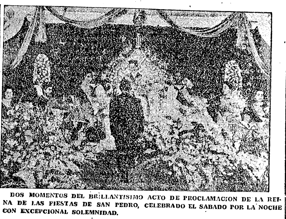
DOS MOMENTOS DEL BRILLANTÍSIMO ACTO DE PROCLAMACIÓN DE LA REINA DE LAS FIESTAS DE SAN PEDRO, CELEBRADO EL SABADO POR LA NOCHE CON EXCEPCIONAL SOLEMNIDAD.

En nuestro número del domingo dimos cuenta, aunque en forma muy sucinta, del solemne acto que en la noche del sábado en el Grao, siguiendo nuestra promesa ampliamos la referida información por la importancia que encierra este acto, pregon maravillosa de unas fiestas que durante varios días alegrarán la vida plena de trabajo y alegría de los habitantes de Peñíscola.