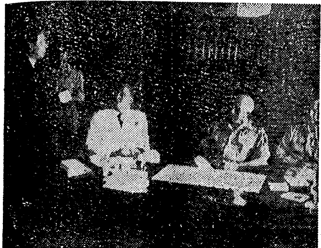
Soustelle, el famoso político francés que, burlando la vigilancia de la policía, pudo trasladarse a Argel, aparece en la foto con el General Salan y algunos miembros del comité de salud pública.

El Ejército y el pueblo argelino han paralizado la política de abandono, dice Soustelle en Orán