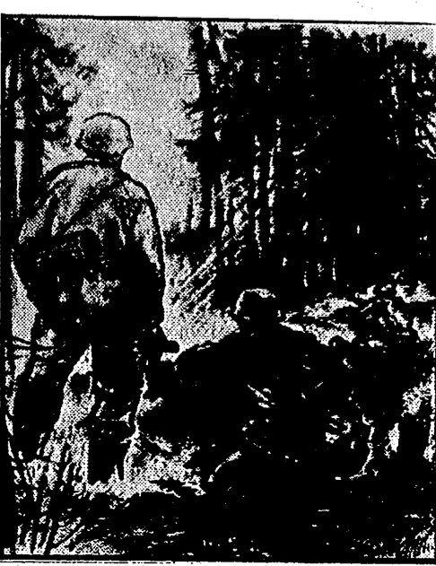
Los artistas alemanes se ejercitan en el frente recogiendo apuntes del natural con interesantes momentos de la lucha. Aquí un dibujante representa la acción de los granaderos alemanes en el frente del Este.

Tokio. — «El espíritu combativo de las fuerzas armadas japonesas en la isla de Attu está intacto», ha declarado el general Yahagi, basándose en las últimas informaciones de aquel frente.