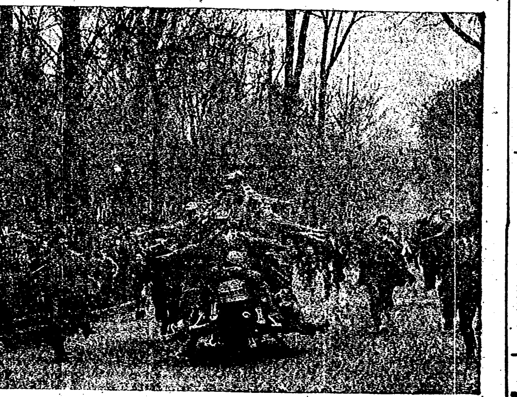
Logró circular más de 600 metros, montando veinticinco personas, con un peso de 1.564 kilogramos. Una magnífica iniciativa y organización del Moto Club Burgalés...