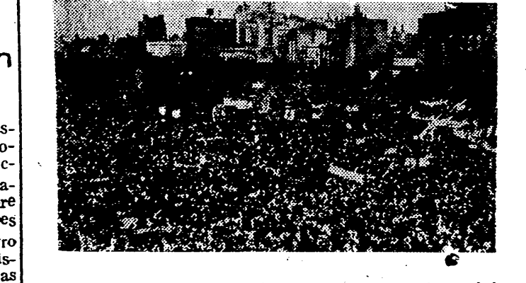
El Partido Laborista argentino se prepara para las próximas elecciones presidenciales a cuya jefatura aspira el jefe laborista Perón. He aquí una de las reuniones populares celebrada en la Avenida del Siéte de Julio de Buenos Aires.

Pittsburg, 22. — 900.000 obreros de la industria del acero, se encuentran en huelga en Estados Unidos. Mas de 1.200 fábricas están cerradas por los piquetes de huelguistas, sus obreros, que piden el aumento de un dólar 48 centavos por hora. Se calcula que pronto se dejarán sentir los efectos de esta huelga en otras industrias. — Efe.