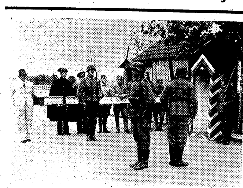
Momento del relevo de los centinelas alemanes en la frontera franco-española

A las nueve cincuenta ha salido la primera bola con el número 24.503, premiado con cien mil pesetas. A las nueve cincuenta y dos, a los dos minutos de comenzar el sorteo ha salido el primer premio de ciento cincuenta mil pesetas, correspondiente al número 53.366, distribuido en Madrid. A las diez en punto salió el primer premio de cincuenta mil pesetas, correspondiente al número 46.883. El primer octavo premio de doscientas cincuenta mil pesetas ha salido a las diez y diez, correspondiendo al nú-