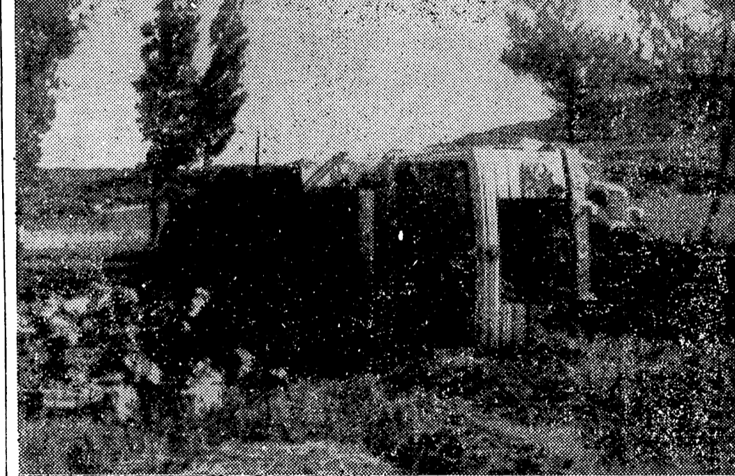
En las proximidades de Arniñón, en la carretera M-1, volcó un camión y quedaron desparramadas por el suelo las botellas de sidra que transportaba...

El (banco de ojos) de Inglaterra ha devuelto la vista a siete personas