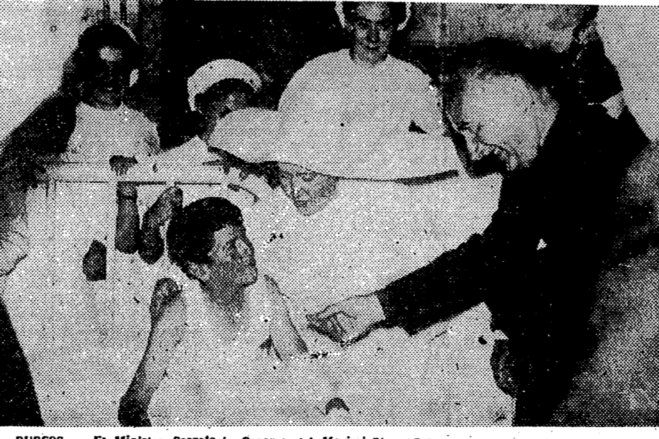
BURGOS. — El Ministro Secretario General del Movimiento conversa con uno de los muchachos del Frente de Juventudes herido en el trágico accidente ocurrido cuando volvió el vehículo en que viajaba, en compañía de otros camaradas, de regreso del campamento "Cid Campeador".