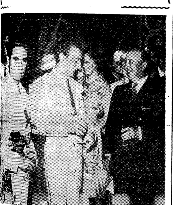
SAN SEBASTIAN. — S. E. el Jefe del Estado departe con los señores Lini, Martret y Girón, en un descanso de la corrida celebrada el domingo. — (Foto Cifra Gráfica).