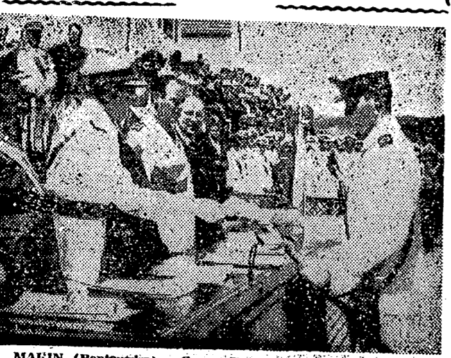
MARIN (Pontevedra). — S. A. R. el príncipe Juan Carlos, en el momento de recibir su nombramiento de alférez de fragata de la Marina española, durante la ceremonia de fin de curso en la Escuela Naval.

LLOYD REGRESA A LONDRES LONDRES, 21. — El Secretario del Foreign Office, Selwyn Lloyd, ha declarado, a su regreso de Norteamérica, que el Occidente no tiene nada que objetar a la celebración de conversaciones de alto nivel con los soviets, siempre que éstas se celebren "dentro del marco adecuado". Añadió que la ONU es el organismo que deberían continuar intentando la resolución de la crisis del Oriente Medio. Interrogado sobre la afirmación del primer Ministro soviético de que el mundo se encuentra "al borde de la guerra", Lloyd respondió: "No creo que la actual situación constituya una amenaza a la paz mundial". — Efe. MAC MILLAN SERA EL PRIMERO EN ESTEAR LONDRES, 21. — El primer Ministro británico, Harold Mac Millan, será el primero que contestará a la propuesta del primer Ministro ruso, Krushev, para la celebración de una conferencia de alto nivel, de cinco potencias, según ha anunciado un portavoz gubernamental. Añadió que Mac Millan lo haría esta tarde en la Cámara de los Comunes, hacia las 15:30 (hora española). Fuentes autorizadas dicen que en su réplica Mac Millan expondrá los siguientes puntos: 1. — Rechazar la inmediata reunión en Ginebra como propone Krushev.