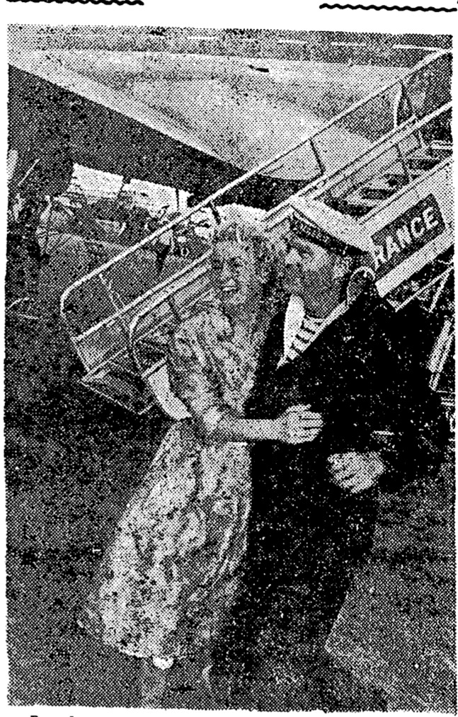
Procedente de Argelia, y con motivo de las fiestas del 11 de julio, llegaron al aeródromo de Orly, veinte militares, a los que se les había concedido un permiso especial de cinco días, para poder ver a sus novias. Un momento de la llegada de los militares.