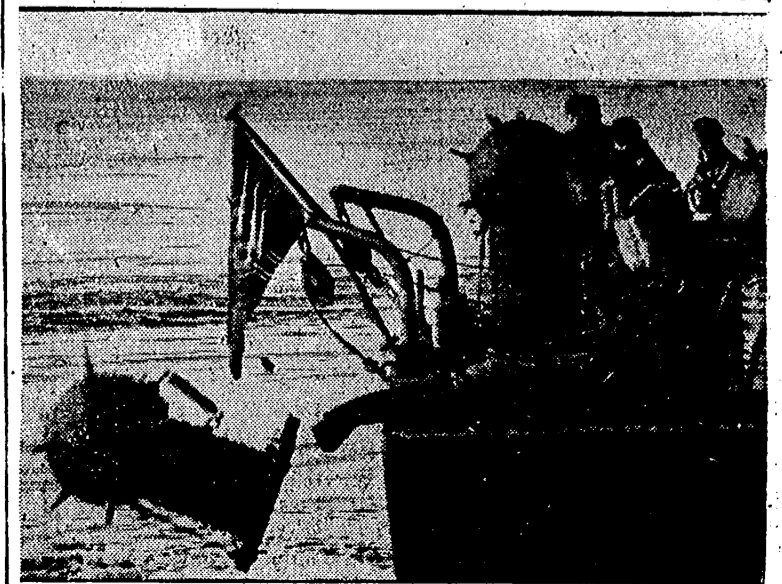
Esta pequeña embarcación alemana de colocar minas en el mar, para entorpecer la navegación de los barcos enemigos.

Sanghai. — La Compañía de ferrocarriles de la China Central, ensaya actualmente la utilización de vagones de mercancías construidos enteramente de bambú. — Efe.