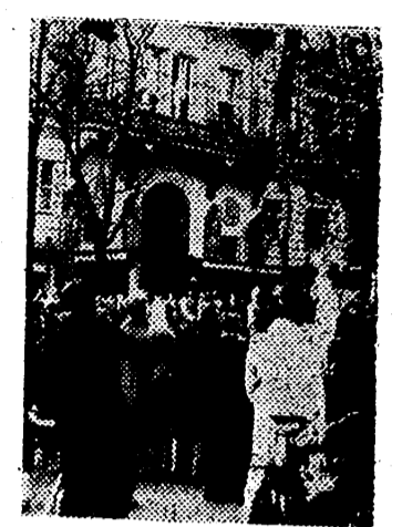
El público vienés aclama al Canciller Hitler, en uno de sus recientes viajes a Viena

Las baterías de la Alcazaba dispararon las salvas de ordenanza.