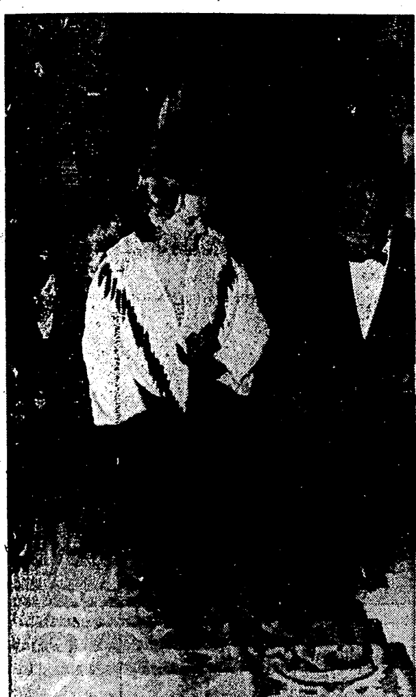
BARCELONA. — La Princesa Irene de Holanda, recién llegada a Barcelona, ha asistido esta noche a la función del Gran Teatro del Liceo. La Princesa ocupó el palco del Ayuntamiento. En la foto, un momento de su llegada al Liceo.