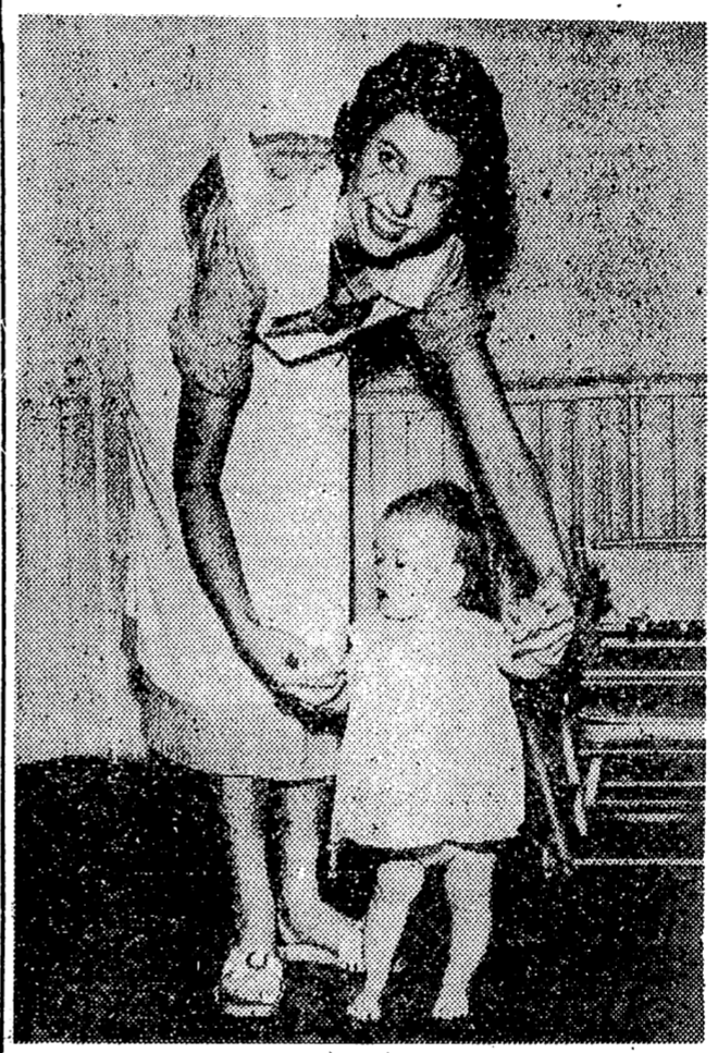
ESTOCOLMO. -- La princesa Desirée de Suecia, de 19 años, ayuda a este simpático pequeño en sus primeros pasos y se muestra muy gozosa de ello, ya que sigue un curso en una guardería infantil de esta capital, por la que también pasó su hermana mayor, la princesa Margarita, no hace mucho tiempo.