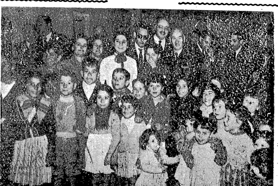
VALENCIA. — El Ministro de la Vivienda, Sr. Arrese, que se encuentra en esta capital, visitó ayer el Distrito marítimo. En la Lonja del Peacado, se fotografió con las familias allí acogidas provisionalmente, hasta que se las construya viviendas. —