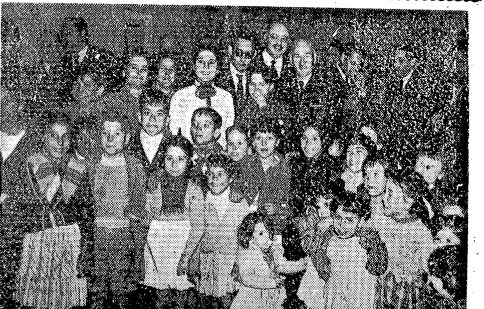
VALENCIA. — El Ministro de la Vivienda, Sr. Arrese, que se encuentra en esta capital, visitó ayer el Distrito marítimo. En la Lonja del Pez, se fotografió con las familias allí acogidas provisionalmente, hasta que se las construya viviendas. —