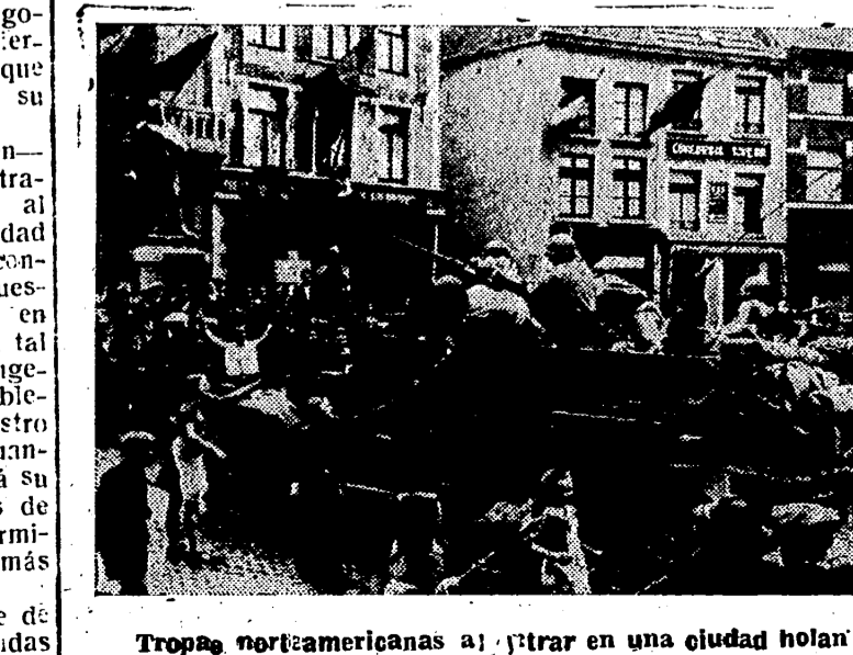
Tropas norteamericanas al entrar en una ciudad holandesa son recibidas con muestras de alegría por la población.

Vertical text on the right edge of the page, including 'DIARIO', 'AN', 'En h U', and other fragments.