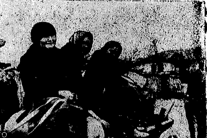
Ante la proximidad de las fuerzas rusas, estas mujeres que residen en territorios ocupados por los alemanes abandonan sus hogares encaminándose a la retaguardia alemana. En la foto, se ven los objetos más indispensables.