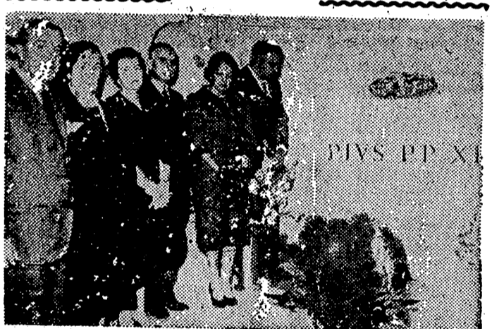
CIUDAD DEL VATICANO. — La misión extraordinaria que España envió a las solemnidades fúnebres por el Papa Pío XII, durante su visita a la tumba del Pontífice, acompañada del embajador en la Santa Sede, señor Gómez de Llano.