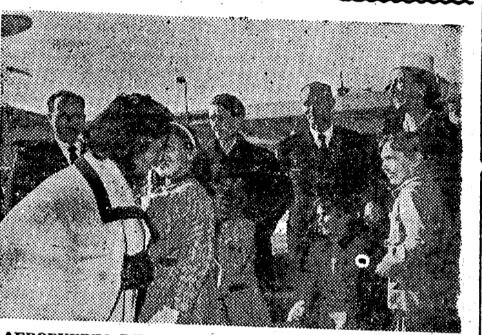
AEROPUERTO DE BARAJAS. — A su regreso de los Estados Unidos, la marquesa de Villaverde es recibida en el aeropuerto por su madre, la esposa de S. E. el Jefe del Estado; sus cuatro hijos mayores y otros familiares, personalidades y amigos.

La Marquesa de Villaverde regresa de EE. UU.