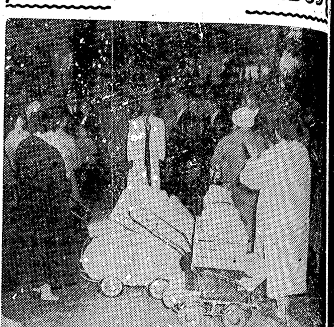
BERLIN. — El canciller Adenauer durante su visita al campo de refugiados procedentes de Alemania oriental, establecido en Litzfelde, con motivo de su estancia en esta capital, para asistir a la reunión del Parlamento, donde se trató, entre otras cosas, del problema de los refugiados alemanes. — (Foto Citra)

El nuevo embajador de la RAU en Roma se nombrará después de la visita Fanfani, (FIEL)