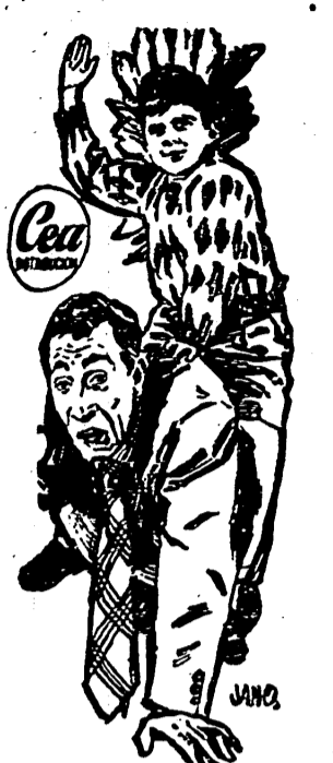
PAQUITA RICO EN