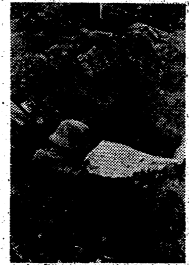
Durante un alto en el fuego. Este soldado de una avanzadilla alemana en las inmediaciones de San Petersburgo, repasa el periódico de campaña que le han dado

A las doce de la noche será leída por el micrófono de Radio Nacional, una evocación por el camarada Valdecasas. — Cifra.