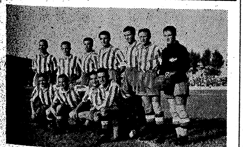
El equipo del A. Aviación que jugó anteayer en el Sequiol...