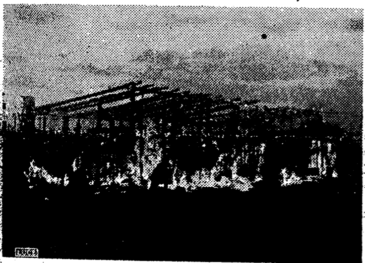
Patrulla de choque del cuerpo expedicionario italiano en Rusia. Hege a una ciudad soviética incendiada por los rojos en su retirada.

Madrid. — El ministro de Agricultura ha asistido en los estudios cinematográficos de San Martín a las pruebas de algunas películas editadas por el Departamento de Propaganda del Ministerio de Agricultura sobre el corcho y sus labores, la seda y su industria. — Cifra.