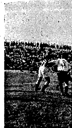
Pizá, veterano y tal, muchos sustos anteayer. la derecha, como en los tanto ladeado.