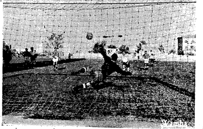
El Castellón pudo forzar el tanteo en el primer tiempo. En la foto superior vamos a Mambión lanzándose hacia Ortega, por sí acaso.

Peró un penalty con el que el señor Jiménez Molina castigó al Castellón siendo más riguroso que con los forasteros, torció el rumbo del marcador, pues Alvarez, como ustedes pueden ver, batió a Guillermo. (Fotos Wamba).