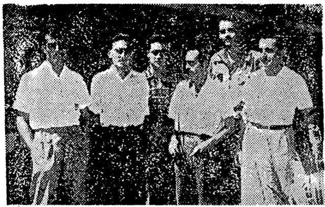
Los representantes catalanes en la expedición considerada como la mayor aventura subterránea del mundo.

BURGOS, 20. — La gran mayoría de los espeleólogos que participan en la operación "Ojo Guareña", se encuentran ya bajo tierra, actuando conjuntamente españoles y extranjeros y distribuidos en los tres pisos del complejo subterráneo. La expedición de punta ha topografiado ya varios kilómetros. Un grupo de italianos se dispone a forzar el sitio de "Cornejo" y han sido exploradas nuevas galerías. Llegan noticias de que se han efectuado importantes descubrimientos arqueológicos, entre ellos un grabado rupestre de excepcional importancia y un animal acuático de especie desconocida, así como fósiles y restos prehistóricos. —A.M.