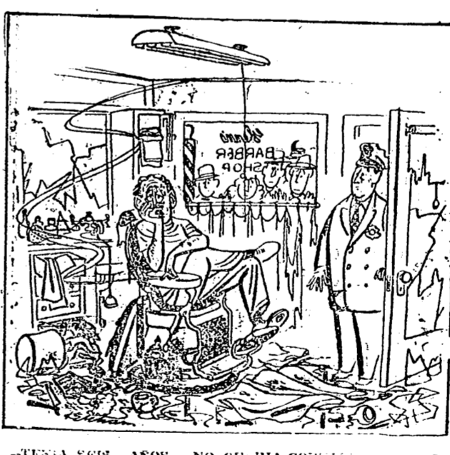
—TENIA FEIS AÑOS... NO QUERIA COMER... LA MAMA INSISTIO...