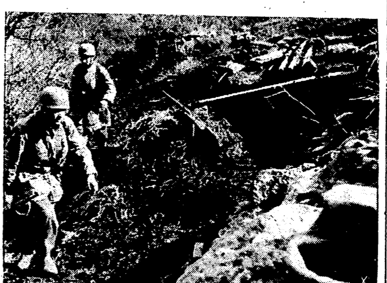
Desde hace algún tiempo registran las informaciones alemanas movimientos y preparativos aliados en la cabeza de puente de Nettuno...