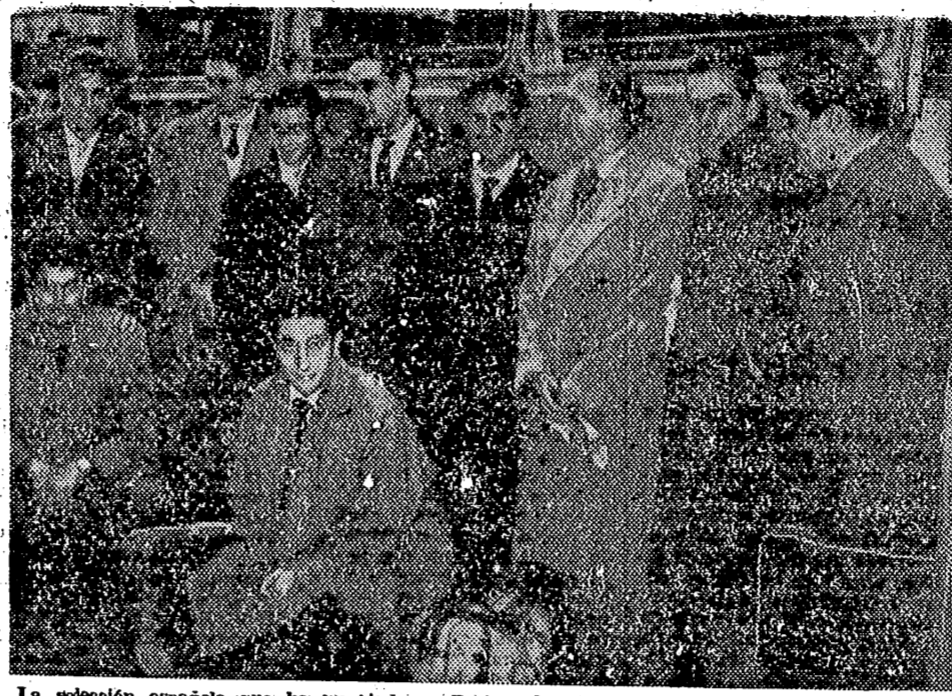
La selección española que ha empatado en París y ha sido derrotada en Francfort, durante su viaje, que está dando lugar a muchas críticas en la prensa española.