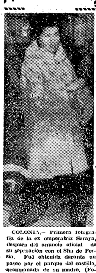
COLONIA. — Primera fotografía de la ex emperatriz Saraya, después del anuncio oficial de su separación con el Sha de Persia. Fue obtenida durante un paseo por el parque del castillo, acompañada de su madre.