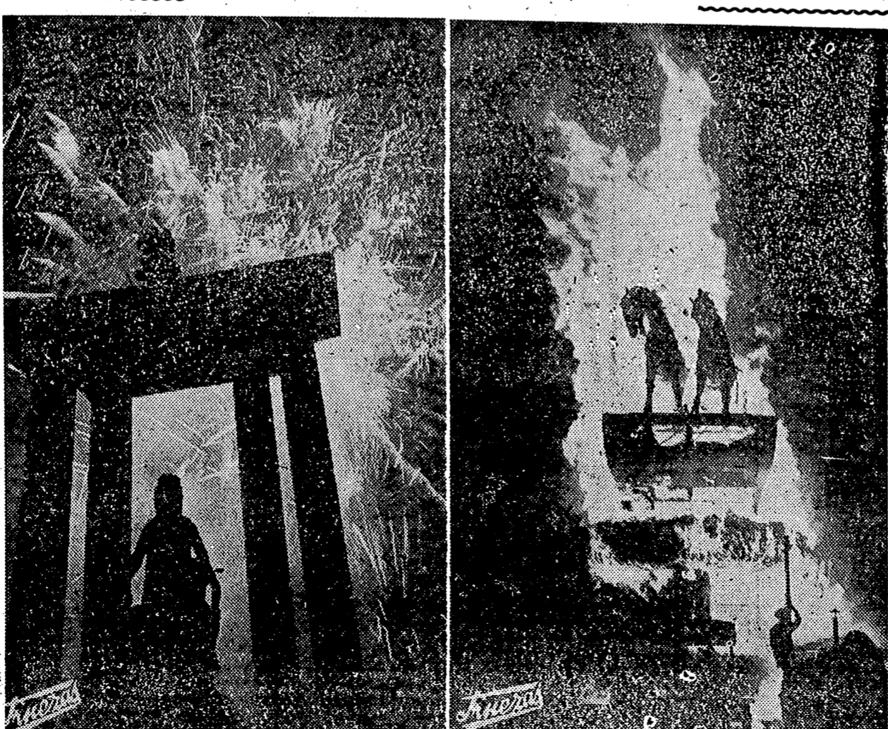
VALENCIA.—En la noche del miércoles se celebró la «crema» de las fallas, poniéndose con esto, apoteosis fin a los tradicionales festejos valencianos. Las fotografías recogen los momentos en que las linternas se encargan de destruir las fallas de la Plaza de Cañalizo y Jerusalén.