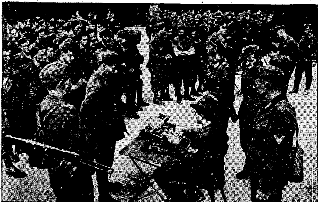
Unidades completas de soldados italianos se ven apuntado para seguir luchando al lado de las tropas alemanas. Nuestra fotografía refleja una de estas escenas en una localidad al Sur de Francia.

NUE «En tura, multa activa preciso denuda