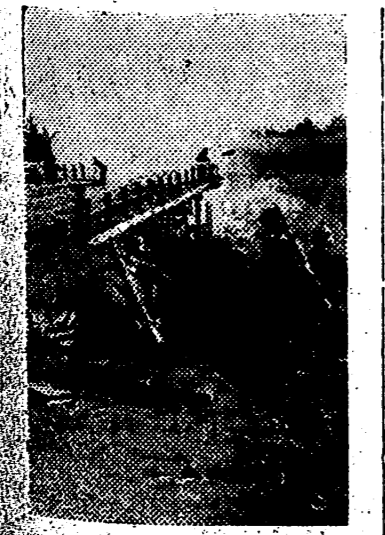
Mientras algunos soldados alemanes intentan apagar el incendio deliberado del puente, otros preparan el ataque antitanque que vigila la previsión cualquier contraataque soviético.

En 1937 la C. N. S. local, asesorada por la delegada de la Sección Femenina acometió la ingente tarea de reunir a todos los elementos de los antiguos talleres de bordado, y hoy el pequeño taller donde se iniciaron estas actividades se ha convertido en una gran casa donde trabajan diariamente más de 300 obreras y a la que acuden todos los mercados de España en demanda de labores a las que difícilmente puede darse abasto. — Cifra.