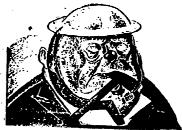
Ultima fotografia de Mr. Churchill, según la «Gazeta del Popolo».