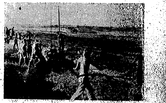
En el avance de las tropas de infantería para las malas carreteras y flechas de las partes a las fuerzas armadas para su El Servicio de Trabajo alemán sigue en...

Barcelona. — «El Correo Catalán» cumple hoy sus 75 años de existencia y ha alcanzado el número 20.000 de su edición. — Cifra.