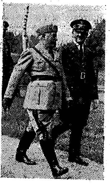
Adolfo Hitler y Benito Mussolini pasean por las inmediaciones del Cuartel General del Führer, durante la reciente visita del Duce al frente oriental.

Los comisarios políticos han tomado medidas para evitar que cunda un ambiente propicio para la paralización de las hostilidades.